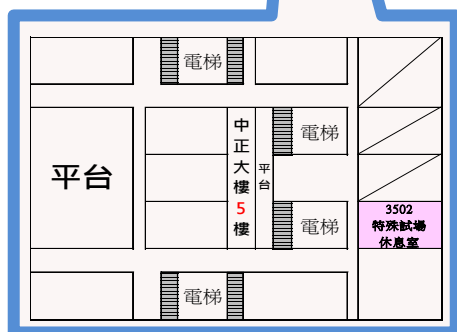
【中正大樓 5 樓-平面圖】